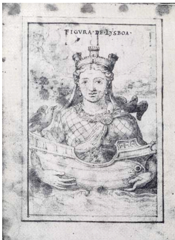
Fig 3 – Figura de Lisboa, FL.2v do manuscrito Da Fabrica que Falece (1571)

Deixando claro seus objetivos, ele afirma querer “ imprimir nobreza de arquitetura e arranjo urbanístico ” para a cidade, naquele momento ou no futuro. Francisco de Holanda, através deste texto ilustrado, demonstra ter consciência de que as imagens poderiam auxiliar na educação do Príncipe e da Corte, além de servir também para propaganda política de Portugal a outros reinos e repúblicas.